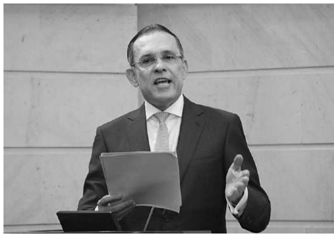
Plan Nacional de Desarrollo.

El Presupuesto General de la Nación aprobado para el 2023 es de $404 billones, un 13% superior al 2022 ($352,7 billones). En total, un 63% corresponde a gastos de funcionamiento y un 19% a servicio de la deuda. Un 18% corresponde a los recursos de inversión con los cuales el Gobierno debe financiar los programas y proyectos para alcanzar las metas del